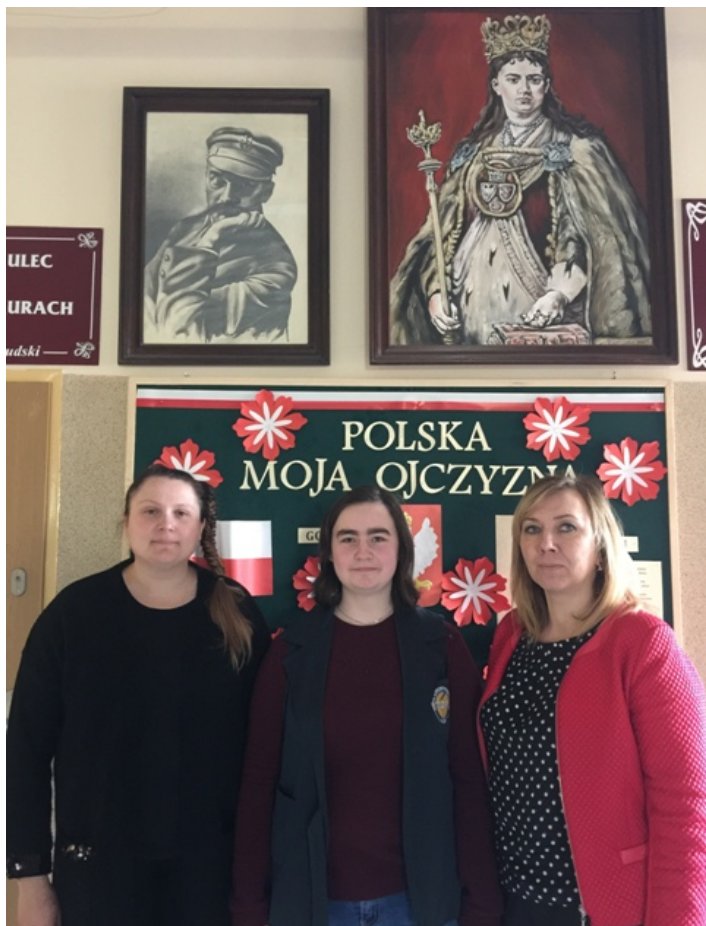
Biologia: Dym Renka Wajdaszyl + gaurazjum