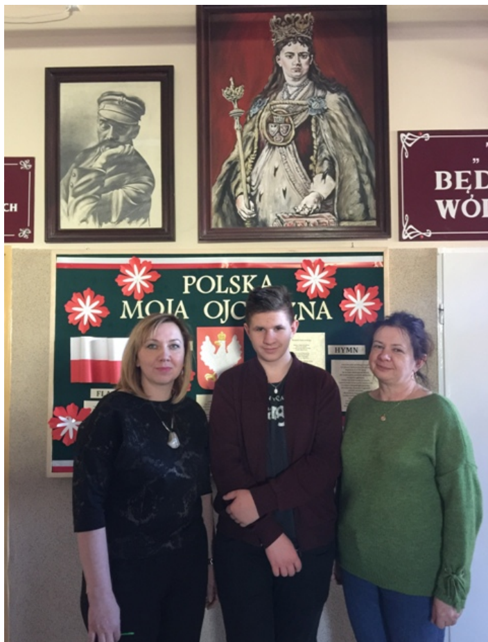
Gratulujemy również ich rodzicom oraz nauczycielom.