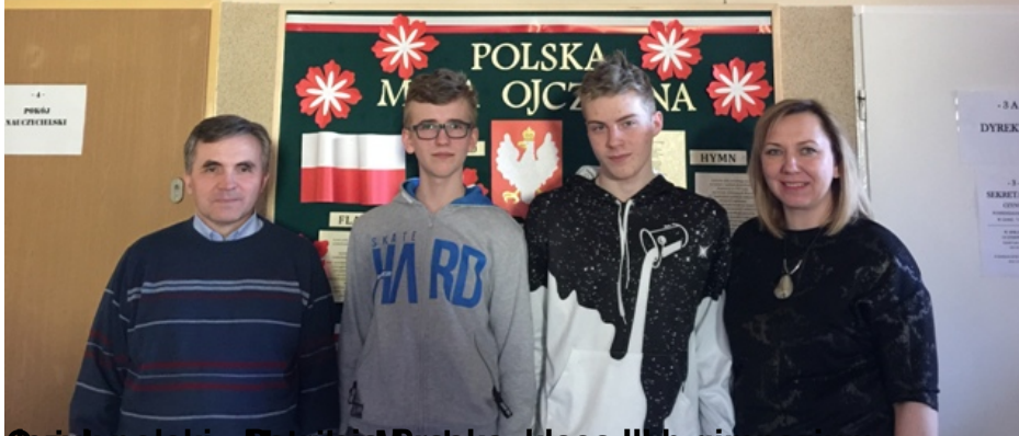
Opięć polskich Ratowników Państwa, klasa III b gimnazjum